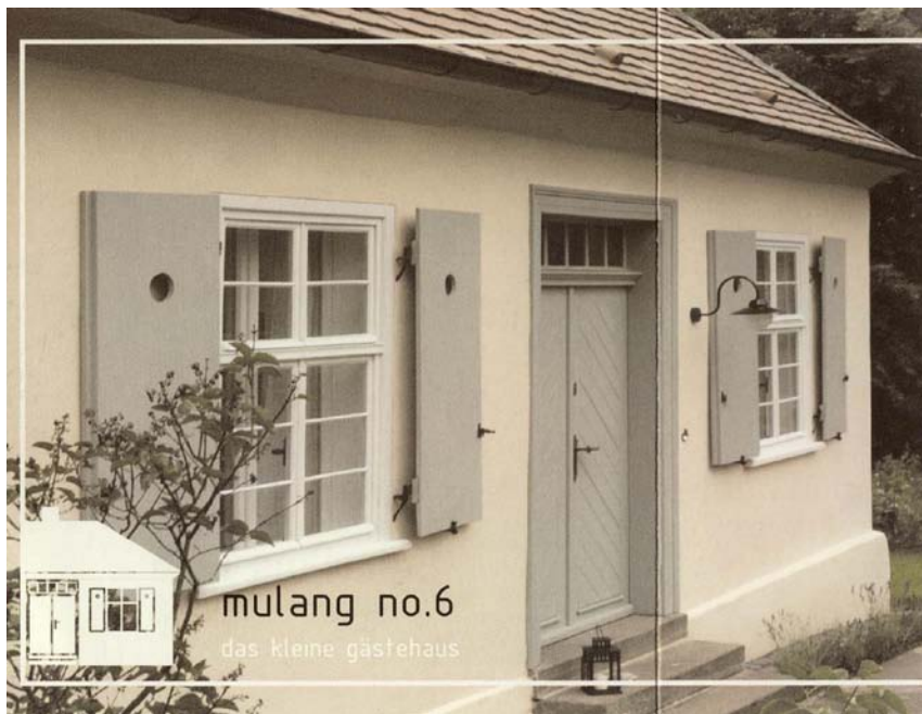
mulang no.6 das kleine gästehaus

Übernachten in einem der ältesten Häuschen des Mulang-Ensembles am Schloss Wilhelmshöhe.