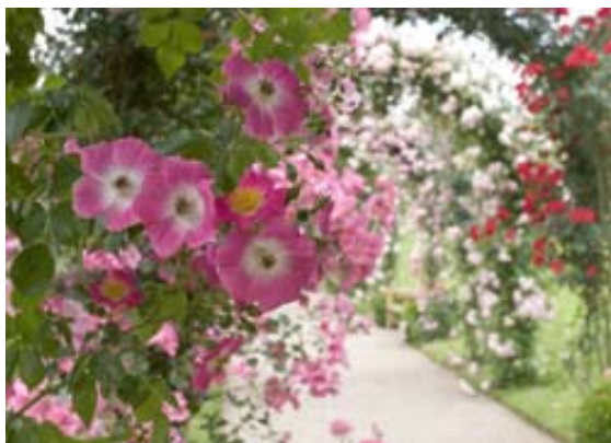
Auf dem Beutig, Baden-Baden.