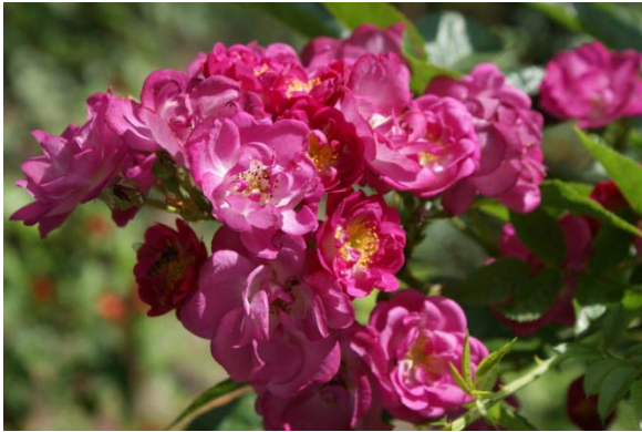
„Verdi“, Moschata-Hybr., Lens 1984